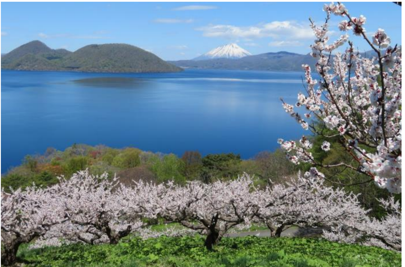
北海道神宮(四月下旬~~五月上旬)