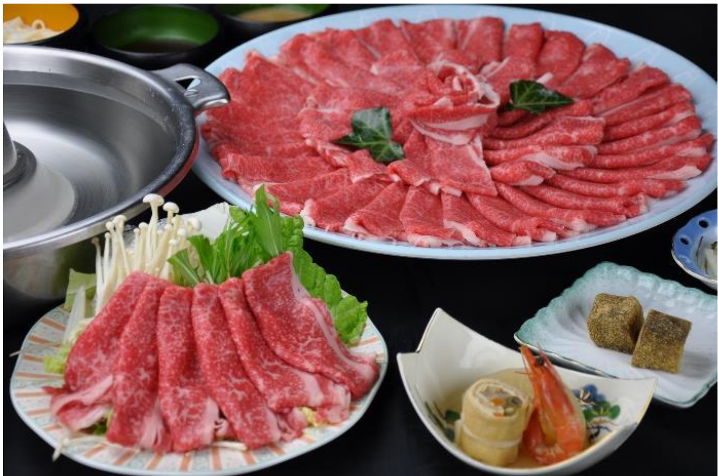
★壽喜燒吃到飽~~北國鏘鏘鍋~~