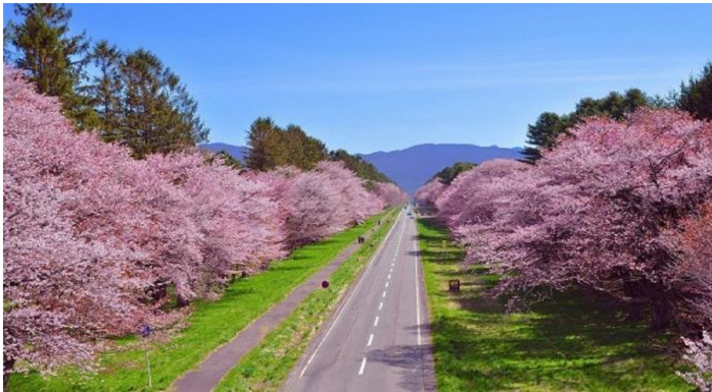
五稜郭公園(賞櫻名所・四月下旬~~五月上旬/北海道第一名城/日本百選名城)